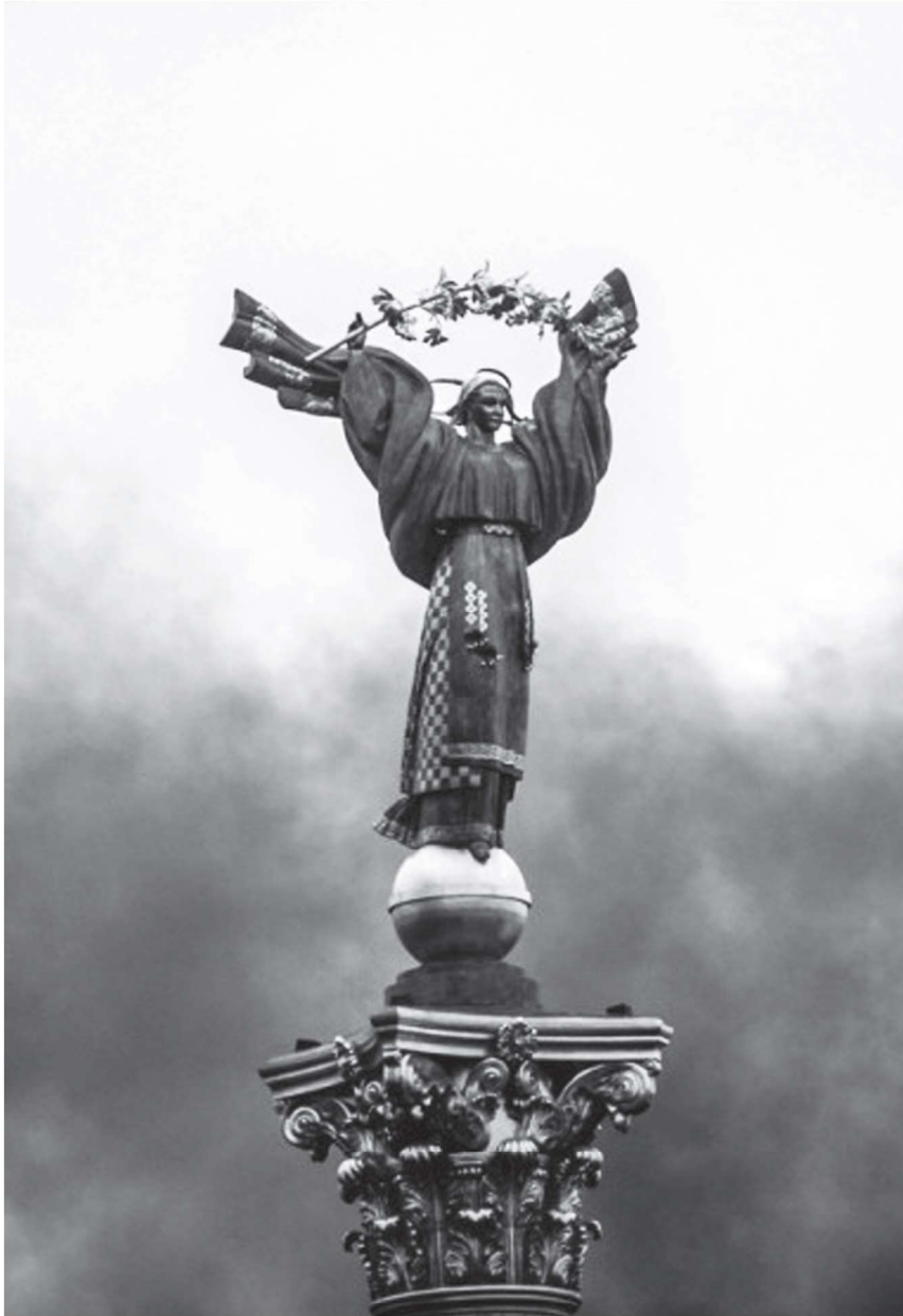
Монумент Незалежності розташований в місті Києві на Майдані Незалежності