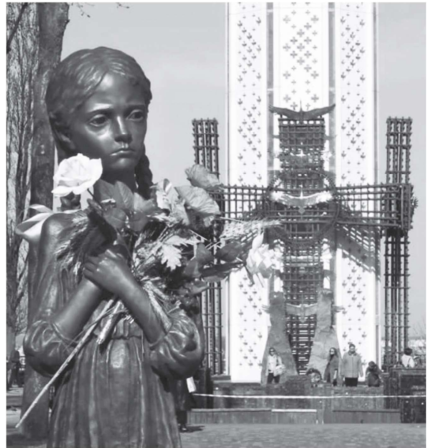
Національний музей «Меморіал жертв Голодомору» в Києві