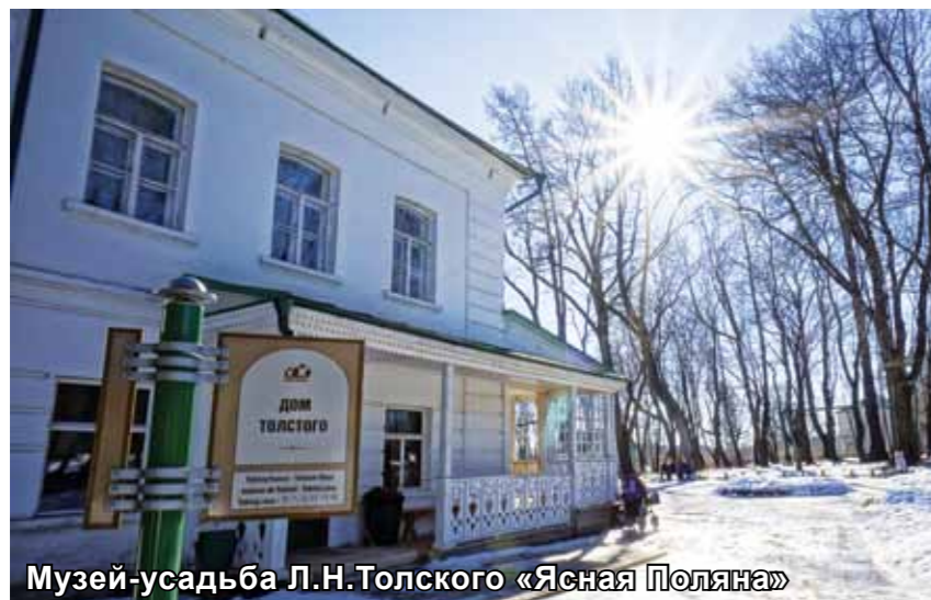
Музей-усадьба Л.Н.Толстого «Ясная Поляна»

Тульская область ценит свои традиции и готова работать на перспективу, а значит люди, помнящие свою историю, свои корни и решившие строить собственное будущее на новом месте, могут рассчитывать здесь на поддержку и понимание.