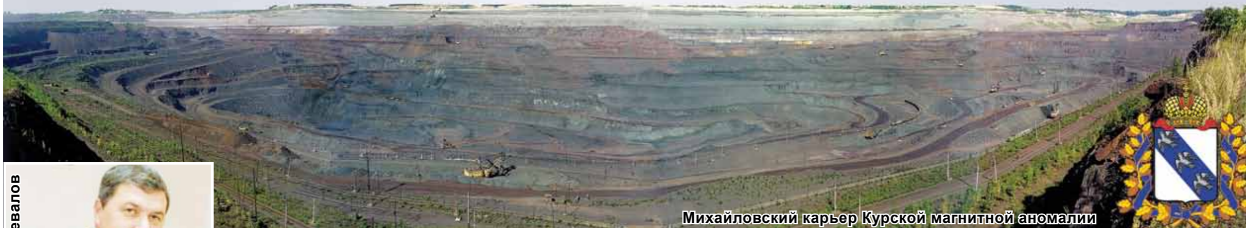
Михайловский карьер Курской магнитной аномалии