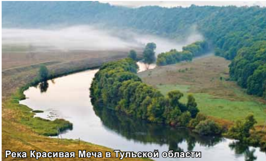
Река Красивая Меча в Тульской области

В регионе развиваются и новые направления аграрного бизнеса.