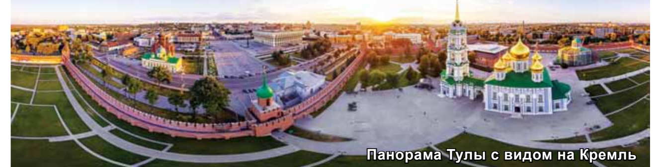
Панорама Тулы с видом на Кремль