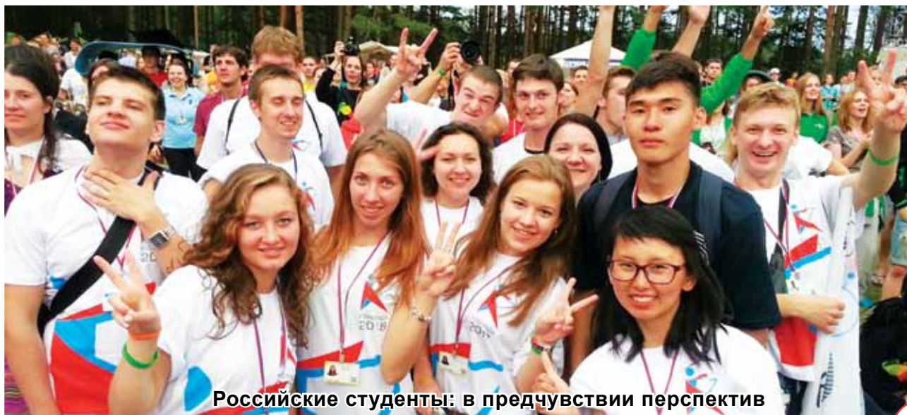
Российские студенты: в предчувствии перспектив

Контакты в Киеве: E-mail: rsukr.obr@mail.ru Телефон/факс: +38 (044) 379-12-27