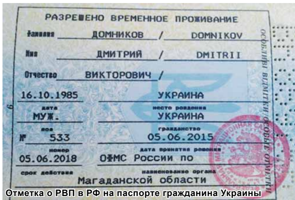
Отметка о РВП в РФ на паспорте гражданина Украины

8. Документ, подтверждающий владение иностранным гражданином русским языком, знание истории России и основ законодательства РФ. К таким документам относятся: